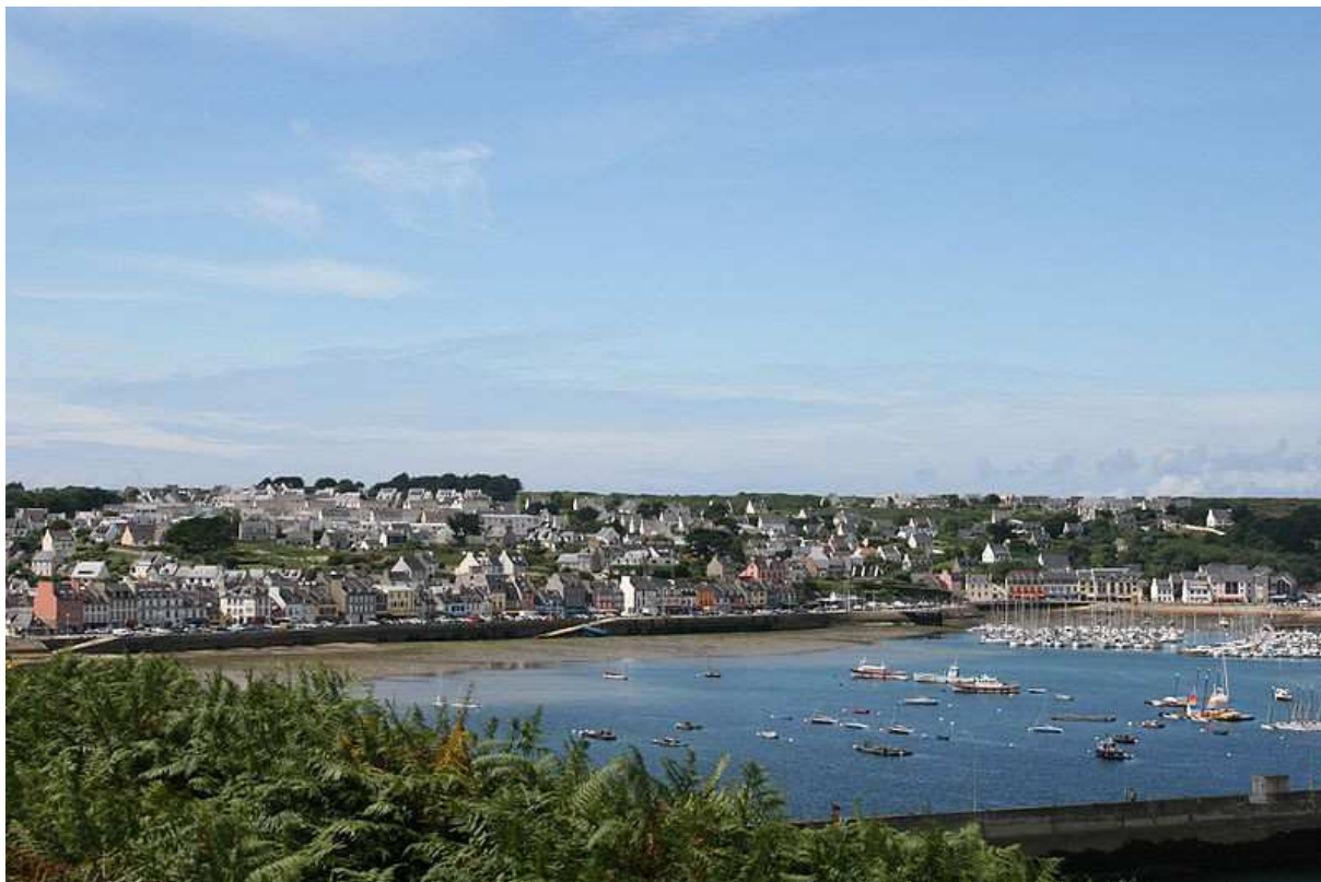
Blick auf den Hafen von Camaret sur Mer