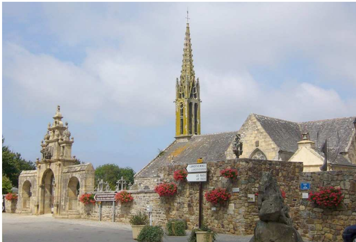
Blick auf Ortszentrum mit seiner sehr schönen Kirche