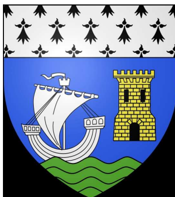
Das Wappen des Ortes