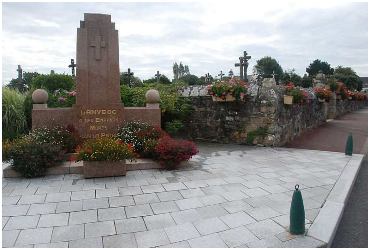
Das monument aux morts für die Gefallenen 1914 - 1918